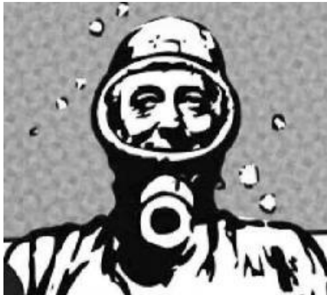
Ilustración I 12